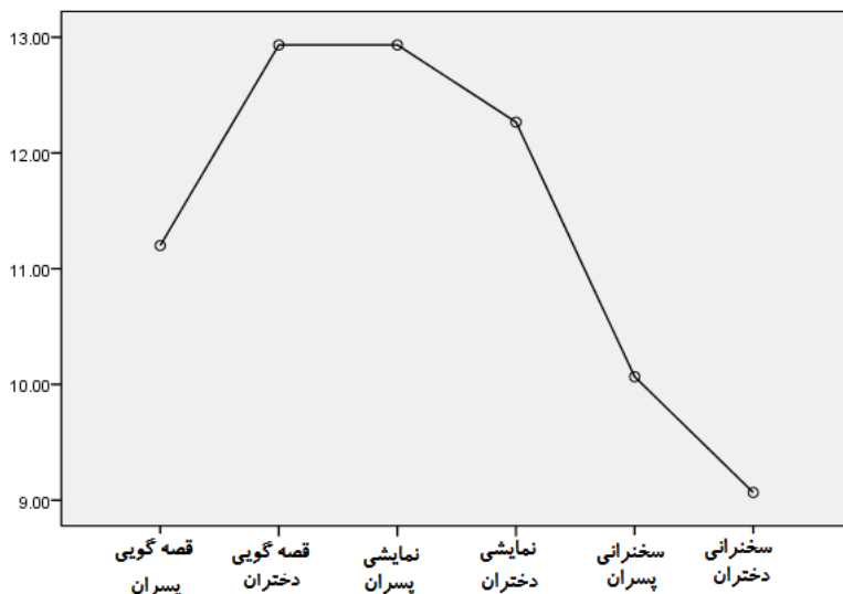
نمودار شماره ۲- بررسی وضعیت حالات تعاملی روش * جنسیت در باب یادگیری میراث ناملموس

جهت تعیین تفاوت بین حالات تعاملی شش گانه از آزمون تعقیبی ال اس دی استفاده شد که نتایج آن در جدول زیر ارائه می‌شود. لازم به ذکر است حالت روش قصه‌گویی دختران و نمایش خلاق مشارکتی پسران بیشترین اثر و حالت سخنرانی دختران کمترین اثر بر یادگیری میراث ناملموس دارند.