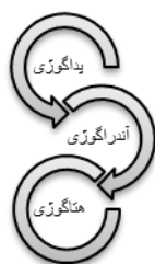
شکل ۱- زنجیره گوژی‌ها

سیر تکوین و شکل‌گیری مفهوم هتاگوژی را باید در ریشه‌های آندراگوژی دانست به‌طوری‌که این رویکرد را می‌توان به‌نوعی بسط و گسترش آندراگوژی قلمداد کرد. زنجیره یادگیری از پداگوژی به آندراگوژی و به هتاگوژی به‌عنوان بخشی از یک فرآیند آموزشی است که در آن مربی/تسهیلگر درحالی‌که توسعه مهارت‌های یادگیری در فراگیرندگان است (شکل زیر):