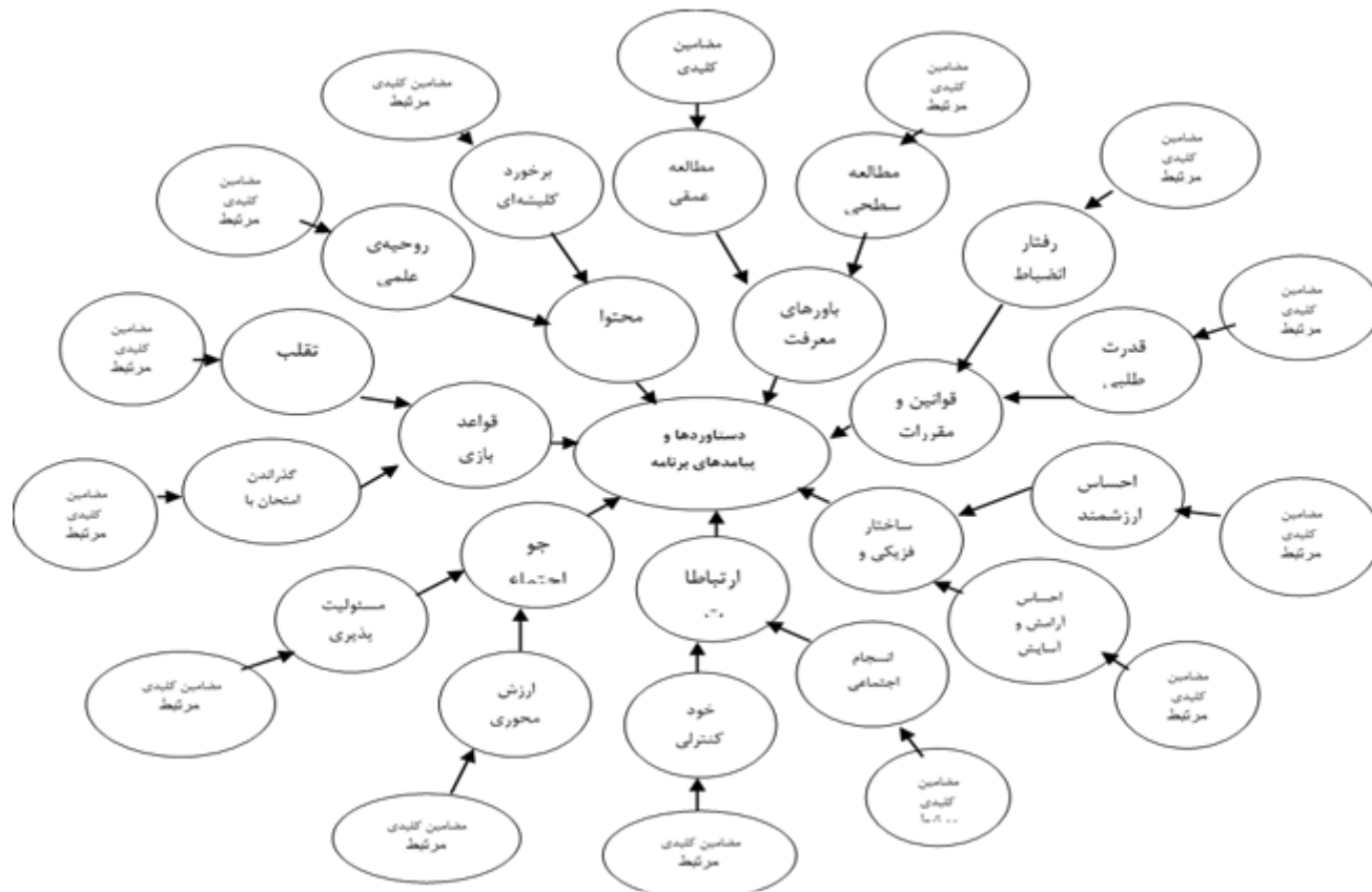
نمودار ۱. شبکه‌ی مضامین دستاوردها و پیامدهای برنامه‌درسی ضمنی دانشگاهی