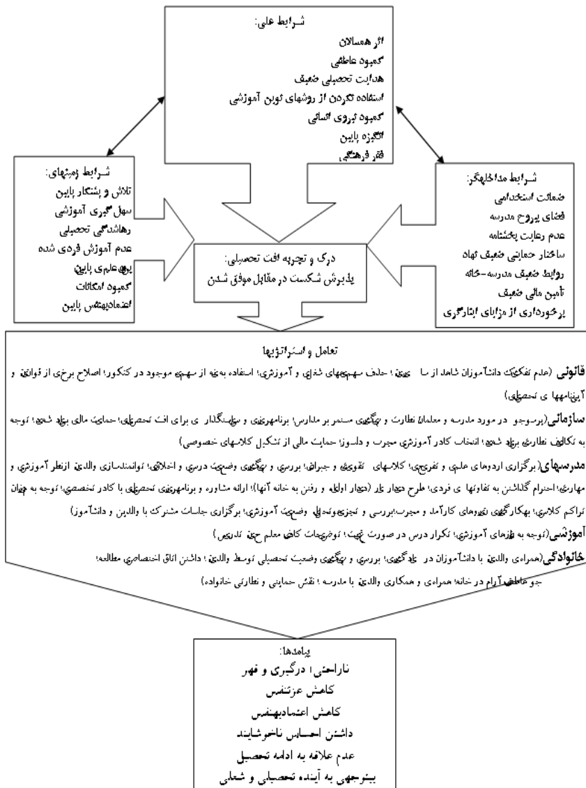
شکل ۲- مدل پارادایمک: افت تحصیلی به‌مثابه پذیرش شکست در مقابل موفق شدن

در مدل پارادایمک پژوهش (شکل ۲)، کنشگران درگیر در افت تحصیلی، این پدیده را به‌مثابه «پذیرش شکست در مقابل موفق شدن» درک و تجربه می‌کنند.