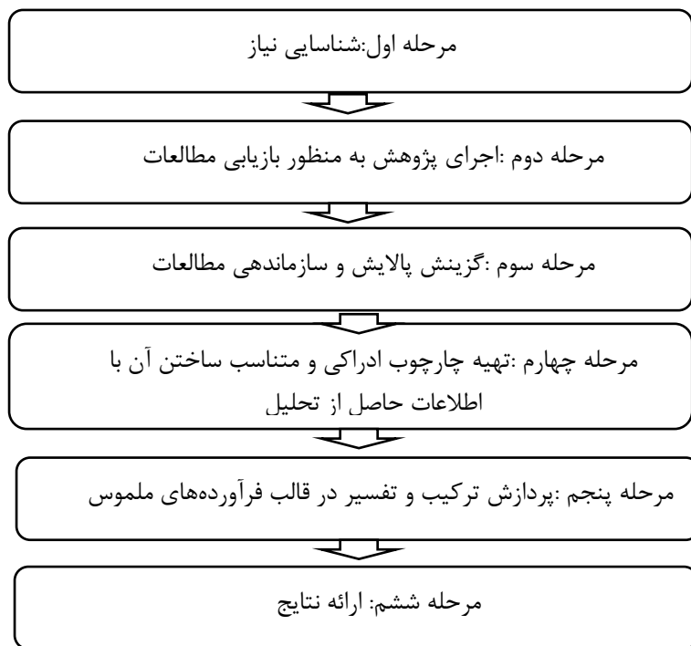
شکل ۱: الگوی شش مرحله ای رابرتس (مارش ۲ ، ۱۳۹۲)

سپس با استفاده از کاربردگر طراحی شده توسط پژوهشگران (پیوست الف)، اطلاعات هر کدام از ۲۴ سند مکتوب، ثبت شد. سپس با استفاده از الگوی شش مرحله-ای سنتز پژوهی رابرتس ۱ (شکل ۱) داده‌ها تحلیل شدند و ویژگی‌های برنامه درسی ریاضی دوره ابتدایی با رویکرد شناختی، استخراج گردید. آنگاه این ویژگی‌ها با ویژگی‌های تبیین شده در پژوهش زادشیر، عصاره، غلام‌آزاد و امام‌جمعه (۱۴۰۱) با هم مقابل شدند که نتیجه آن، طراحی اولیه الگویی برای برنامه درسی ریاضی دوره ابتدایی مبتنی بر رویکرد شناختی بود.