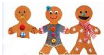
تصویر شماره ۱: دو و نیم!

و نهایتاً مثالی از طنزهای کلامی ارائه شده توسط معلم، بیان حکایت مردی است که به رستوران می رود و در پاسخ به سؤال پیشخدمت که از او می پرسد " پیتزای را به ۴ قسمت تقسیم کند یا ۸ قسمت؟" می گوید " لطفاً ۴ قسمت برش بزنید چون من رژیم دارم!!!"