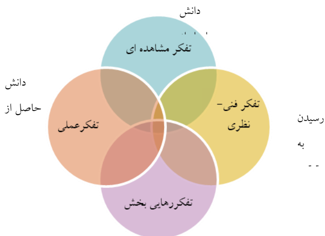
شکل ۱ مدل نظری فرا تفسیری روایت‌نگاری تأملی و توسعه حرفه‌ای

کدام معرف دانش مجزایی است: دانشی که از مشاهده رفتار دیگران کسب می‌شود، دانشی که در موقعیت‌های آموزشی رسمی با اهداف از پیش تعیین شده حاصل می‌شود، دانشی که حاصل به اشتراک‌گذاری با دیگران است و دانشی که با انتقال به موقعیت‌های جدید به دست می‌آید. چهار نوع تفکر مجزا و در عین حال، مرتبط با هم که از این معرفت‌های چهارگانه حمایت می‌کنند عبارتند از: تفکر مشاهده‌ای، تفکر فنی-نظری، تفکر عملی و تفکر رهایی‌بخش.