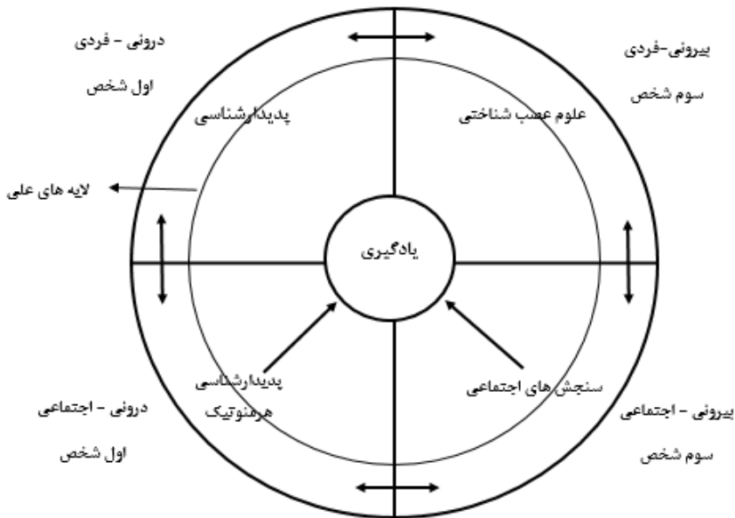
شکل ۳ - ارزشیابی یکپارچه

طبق این الگو، در آغاز در حرکت از سطح به عمق، ابتدا در قالب روش‌های اندازه‌گیری و سنجش رفتار (شناخت و یادگیری مشاهده‌پذیر)، توصیفی کمی از پروژه حاصل می‌گردد و همان‌گونه که بیان شد این توصیف به‌طور غالب بازنمایی اندکی از شناخت و یادگیری نامشهود را ارائه می‌کند. از آنجا که پدیده مورد ارزیابی و سنجش ناشی از ساختارها و لایه‌های علی متعددی است که پیش‌تر ذکر شد، مشارکت‌کنندگان در فرایند ارزشیابی به کمک استنباط فرایندی که ناظر به حرکت و پویایی از رویدادهای ظاهری به سوی سازوکارها و لایه‌های زیرین است (عنایت‌الله، ۱۹۹۸)، به عمق یافت و لایه‌های علی و زیرین شناخت و یادگیری وارد شده و استنباط و تحلیل خود را از ریشه‌های آنچه در ظاهر نمایان می‌شود به دست می‌دهند.