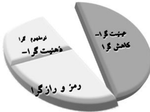
شکل ۱- دو ایده اصلی نظریه‌پردازی که در آن نومفهوم‌گرایی قسمتی از ایده ذهنیت-گرایی - رمز و رازگرایی است.

عصب‌پدیدارشناسی به‌عنوان بستری برای نظریه‌پردازی برنامه درسی، فراتر از دو ایده مطرح شده در این مقاله است. ایده عینیت‌گرا - کاهش‌گرا ۲ برای نظریه‌های تبیینی که ساز و کارهای کنترلی ویژگی آن‌هاست (پرکینسون ۳ ، ۱۹۹۳) و ایده مبتنی بر ذهنیت-گرایی - رمز و رازگرایی ۴ که با دیدگاه‌هایی از قبیل پدیدارشناسی و انسان‌گرایی به جای عینیت‌ها و شواهد آزمایشگاهی، به اول شخص و تجربه انسانی توجه دارد یا با تأکید بر مفاهیم موجود در این حوزه نظریه‌پردازی را تلاشی برای فهم برنامه درسی به مثابه یک متن می‌داند (شکل ۱).