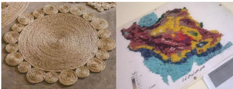
شکل ۸- تلفیق هنر نقاشی با هنر تجسمی: برجسته کاری (به کمک کف و کاموا)