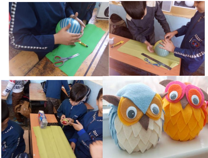
شکل ۳- تلفیق نقاشی با هنر دستی (هنر تجسمی)

شکل ۲- تلفیق داستان سرایی و نمایش همراه با موسیقی خلاقانه دانش آموزان