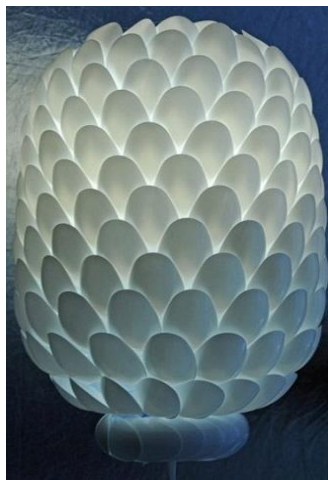
شکل ۱- تلفیق هنر تجسمی و مواد دور ریختنی و ایجاد گل