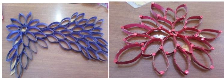
شکل ۷- تلفیق هنر تجسمی با نقاشی همراه با وسایل دور ریختنی