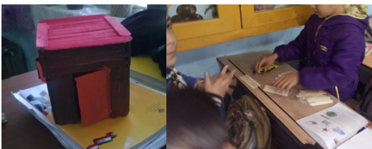
شکل ۹- تلفیق کاردستی و خلاقیت ذهنی (هوش چندگانه)