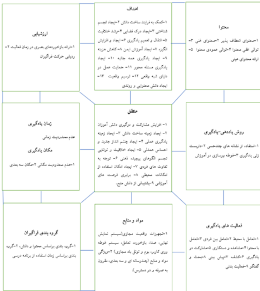
شکل شماره ۲: الگوی برنامه‌درسی مبتنی بر واقعیت مجازی در درس علوم

با توجه به نتایج حاصل از سنتز پژوهی و کدگذاری باز و محوری، به‌طور کلی الگوی برنامه‌درسی مبتنی بر واقعیت در درس علوم دوره‌ششم ابتدایی به‌صورت زیر می‌باشد: